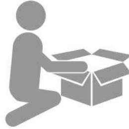
ตรวจสอบสินค้าทันทีที่ได้รับ