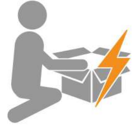
หากสินค้ามีปัญหา ให้แจ้งในช่องแชทร้านค้า

ถ้าสินค้ามีปัญหาขอแตกจากการขนส่งให้รีบแจ้ง และทำเรื่องเคลมในช่องแชทร้านค้า ภายใน 7 วัน เท่านั้น **มีค่าใช้จ่ายในการจัดส่งสินค้าทั้ง ไป-กลับ